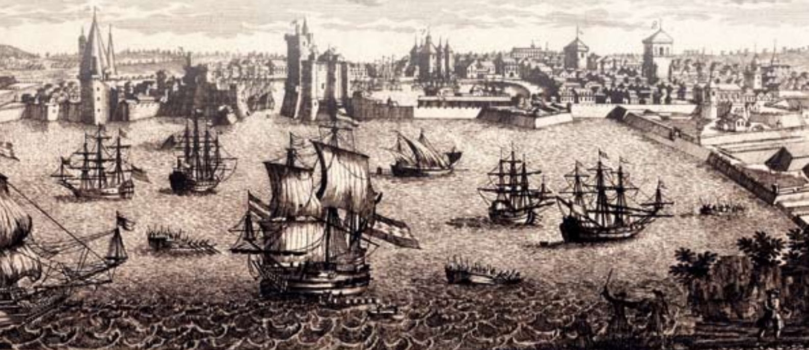
La Ville de la ROCHELLE, Capitale du Pays d'Aunis 1. Tour de S t Sauveur 2. Tour de S t Nicolas 3. Tour de Morilles 4. Tour de S t Pierre 5. Tour de S t Martin 6. Tour de S t Jean 7. Tour de S t Louis 8. Tour de S t Michel 9. Tour de S t Georges 10. Tour de S t Eloi 11. Tour de S t Landry 12. Tour de S t Vincent 13. Tour de S t Etienne 14. Tour de S t Martin 15. Tour de S t Julien 16. Tour de S t Basile 17. Tour de S t Vrain 18. Tour de S t Hippolyte 19. Tour de S t Apollinaire 20. Tour de S t Nicaise 21. Tour de S t Agathe 22. Tour de S t Marguerite 23. Tour de S t Catherine 24. Tour de S t Barbara 25. Tour de S t Julienne 26. Tour de S t Genevieve 27. Tour de S t Margarete 28. Tour de S t Thérèse 29. Tour de S t Anne 30. Tour de S t Gertrude 31. Tour de S t Eustache 32. Tour de S t Valentin 33. Tour de S t Sébastien 34. Tour de S t Pierre 35. Tour de S t Paul 36. Tour de S t Laurent 37. Tour de S t Etienne 38. Tour de S t Martin 39. Tour de S t Julien 40. Tour de S t Basile 41. Tour de S t Vrain 42. Tour de S t Hippolyte 43. Tour de S t Apollinaire 44. Tour de S t Nicaise 45. Tour de S t Agathe 46. Tour de S t Marguerite 47. Tour de S t Catherine 48. Tour de S t Barbara 49. Tour de S t Julienne 50. Tour de S t Genevieve 51. Tour de S t Margarete 52. Tour de S t Thérèse 53. Tour de S t Anne 54. Tour de S t Gertrude 55. Tour de S t Eustache 56. Tour de S t Valentin 57. Tour de S t Sébastien 58. Tour de S t Pierre 59. Tour de S t Paul 60. Tour de S t Laurent 61. Tour de S t Etienne 62. Tour de S t Martin 63. Tour de S t Julien 64. Tour de S t Basile 65. Tour de S t Vrain 66. Tour de S t Hippolyte 67. Tour de S t Apollinaire 68. Tour de S t Nicaise 69. Tour de S t Agathe 70. Tour de S t Marguerite 71. Tour de S t Catherine 72. Tour de S t Barbara 73. Tour de S t Julienne 74. Tour de S t Genevieve 75. Tour de S t Margarete 76. Tour de S t Thérèse 77. Tour de S t Anne 78. Tour de S t Gertrude 79. Tour de S t Eustache 80. Tour de S t Valentin 81. Tour de S t Sébastien 82. Tour de S t Pierre 83. Tour de S t Paul 84. Tour de S t Laurent 85. Tour de S t Etienne 86. Tour de S t Martin 87. Tour de S t Julien 88. Tour de S t Basile 89. Tour de S t Vrain 90. Tour de S t Hippolyte 91. Tour de S t Apollinaire 92. Tour de S t Nicaise 93. Tour de S t Agathe 94. Tour de S t Marguerite 95. Tour de S t Catherine 96. Tour de S t Barbara 97. Tour de S t Julienne 98. Tour de S t Genevieve 99. Tour de S t Margarete 100. Tour de S t Thérèse 101. Tour de S t Anne 102. Tour de S t Gertrude 103. Tour de S t Eustache 104. Tour de S t Valentin 105. Tour de S t Sébastien 106. Tour de S t Pierre 107. Tour de S t Paul 108. Tour de S t Laurent 109. Tour de S t Etienne 110. Tour de S t Martin 111. Tour de S t Julien 112. Tour de S t Basile 113. Tour de S t Vrain 114. Tour de S t Hippolyte 115. Tour de S t Apollinaire 116. Tour de S t Nicaise 117. Tour de S t Agathe 118. Tour de S t Marguerite 119. Tour de S t Catherine 120. Tour de S t Barbara 121. Tour de S t Julienne 122. Tour de S t Genevieve 123. Tour de S t Margarete 124. Tour de S t Thérèse 125. Tour de S t Anne 126. Tour de S t Gertrude 127. Tour de S t Eustache 128. Tour de S t Valentin 129. Tour de S t Sébastien 130. Tour de S t Pierre 131. Tour de S t Paul 132. Tour de S t Laurent 133. Tour de S t Etienne 134. Tour de S t Martin 135. Tour de S t Julien 136. Tour de S t Basile 137. Tour de S t Vrain 138. Tour de S t Hippolyte 139. Tour de S t Apollinaire 140. Tour de S t Nicaise 141. Tour de S t Agathe 142. Tour de S t Marguerite 143. Tour de S t Catherine 144. Tour de S t Barbara 145. Tour de S t Julienne 146. Tour de S t Genevieve 147. Tour de S t Margarete 148. Tour de S t Thérèse 149. Tour de S t Anne 150. Tour de S t Gertrude 151. Tour de S t Eustache 152. Tour de S t Valentin 153. Tour de S t Sébastien 154. Tour de S t Pierre 155. Tour de S t Paul 156. Tour de S t Laurent 157. Tour de S t Etienne 158. Tour de S t Martin 159. Tour de S t Julien 160. Tour de S t Basile 161. Tour de S t Vrain 162. Tour de S t Hippolyte 163. Tour de S t Apollinaire 164. Tour de S t Nicaise 165. Tour de S t Agathe 166. Tour de S t Marguerite 167. Tour de S t Catherine 168. Tour de S t Barbara 169. Tour de S t Julienne 170. Tour de S t Genevieve 171. Tour de S t Margarete 172. Tour de S t Thérèse 173. Tour de S t Anne 174. Tour de S t Gertrude 175. Tour de S t Eustache 176. Tour de S t Valentin 177. Tour de S t Sébastien 178. Tour de S t Pierre 179. Tour de S t Paul 180. Tour de S t Laurent 181. Tour de S t Etienne 182. Tour de S t Martin 183. Tour de S t Julien 184. Tour de S t Basile 185. Tour de S t Vrain 186. Tour de S t Hippolyte 187. Tour de S t Apollinaire 188. Tour de S t Nicaise 189. Tour de S t Agathe 190. Tour de S t Marguerite 191. Tour de S t Catherine 192. Tour de S t Barbara 193. Tour de S t Julienne 194. Tour de S t Genevieve 195. Tour de S t Margarete 196. Tour de S t Thérèse 197. Tour de S t Anne 198. Tour de S t Gertrude 199. Tour de S t Eustache 200. Tour de S t Valentin 201. Tour de S t Sébastien 202. Tour de S t Pierre 203. Tour de S t Paul 204. Tour de S t Laurent 205. Tour de S t Etienne 206. Tour de S t Martin 207. Tour de S t Julien 208. Tour de S t Basile 209. Tour de S t Vrain 210. Tour de S t Hippolyte 211. Tour de S t Apollinaire 212. Tour de S t Nicaise 213. Tour de S t Agathe 214. Tour de S t Marguerite 215. Tour de S t Catherine 216. Tour de S t Barbara 217. Tour de S t Julienne 218. Tour de S t Genevieve 219. Tour de S t Margarete 220. Tour de S t Thérèse 221. Tour de S t Anne 222. Tour de S t Gertrude 223. Tour de S t Eustache 224. Tour de S t Valentin 225. Tour de S t Sébastien 226. Tour de S t Pierre 227. Tour de S t Paul 228. Tour de S t Laurent 229. Tour de S t Etienne 230. Tour de S t Martin 231. Tour de S t Julien 232. Tour de S t Basile 233. Tour de S t Vrain 234. Tour de S t Hippolyte 235. Tour de S t Apollinaire 236. Tour de S t Nicaise 237. Tour de S t Agathe 238. Tour de S t Marguerite 239. Tour de S t Catherine 240. Tour de S t Barbara 241. Tour de S t Julienne 242. Tour de S t Genevieve 243. Tour de S t Margarete 244. Tour de S t Thérèse 245. Tour de S t Anne 246. Tour de S t Gertrude 247. Tour de S t Eustache 248. Tour de S t Valentin 249. Tour de S t Sébastien 250. Tour de S t Pierre 251. Tour de S t Paul 252. Tour de S t Laurent 253. Tour de S t Etienne 254. Tour de S t Martin 255. Tour de S t Julien 256. Tour de S t Basile 257. Tour de S t Vrain 258. Tour de S t Hippolyte 259. Tour de S t Apollinaire 260. Tour de S t Nicaise 261. Tour de S t Agathe 262. Tour de S t Marguerite 263. Tour de S t Catherine 264. Tour de S t Barbara 265. Tour de S t Julienne 266. Tour de S t Genevieve 267. Tour de S t Margarete 268. Tour de S t Thérèse 269. Tour de S t Anne 270. Tour de S t Gertrude 271. Tour de S t Eustache 272. Tour de S t Valentin 273. Tour de S t Sébastien 274. Tour de S t Pierre 275. Tour de S t Paul 276. Tour de S t Laurent 277. Tour de S t Etienne 278. Tour de S t Martin 279. Tour de S t Julien 280. Tour de S t Basile 281. Tour de S t Vrain 282. Tour de S t Hippolyte 283. Tour de S t Apollinaire 284. Tour de S t Nicaise 285. Tour de S t Agathe 286. Tour de S t Marguerite 287. Tour de S t Catherine 288. Tour de S t Barbara 289. Tour de S t Julienne 290. Tour de S t Genevieve 291. Tour de S t Margarete 292. Tour de S t Thérèse 293. Tour de S t Anne 294. Tour de S t Gertrude 295. Tour de S t Eustache 296. Tour de S t Valentin 297. Tour de S t Sébastien 298. Tour de S t Pierre 299. Tour de S t Paul 300. Tour de S t Laurent 301. Tour de S t Etienne 302. Tour de S t Martin 303. Tour de S t Julien 304. Tour de S t Basile 305. Tour de S t Vrain 306. Tour de S t Hippolyte 307. Tour de S t Apollinaire 308. Tour de S t Nicaise 309. Tour de S t Agathe 310. Tour de S t Marguerite 311. Tour de S t Catherine 312. Tour de S t Barbara 313. Tour de S t Julienne 314. Tour de S t Genevieve 315. Tour de S t Margarete 316. Tour de S t Thérèse 317. Tour de S t Anne 318. Tour de S t Gertrude 319. Tour de S t Eustache 320. Tour de S t Valentin 321. Tour de S t Sébastien 322. Tour de S t Pierre 323. Tour de S t Paul 324. Tour de S t Laurent 325. Tour de S t Etienne 326. Tour de S t Martin 327. Tour de S t Julien 328. Tour de S t Basile 329. Tour de S t Vrain 330. Tour de S t Hippolyte 331. Tour de S t Apollinaire 332. Tour de S t Nicaise 333. Tour de S t Agathe 334. Tour de S t Marguerite 335. Tour de S t Catherine 336. Tour de S t Barbara 337. Tour de S t Julienne 338. Tour de S t Genevieve 339. Tour de S t Margarete 340. Tour de S t Thérèse 341. Tour de S t Anne 342. Tour de S t Gertrude 343. Tour de S t Eustache 344. Tour de S t Valentin 345. Tour de S t Sébastien 346. Tour de S t Pierre 347. Tour de S t Paul 348. Tour de S t Laurent 349. Tour de S t Etienne 350. Tour de S t Martin 351. Tour de S t Julien 352. Tour de S t Basile 353. Tour de S t Vrain 354. Tour de S t Hippolyte 355. Tour de S t Apollinaire 356. Tour de S t Nicaise 357. Tour de S t Agathe 358. Tour de S t Marguerite 359. Tour de S t Catherine 360. Tour de S t Barbara 361. Tour de S t Julienne 362. Tour de S t Genevieve 363. Tour de S t Margarete 364. Tour de S t Thérèse 365. Tour de S t Anne 366. Tour de S t Gertrude 367. Tour de S t Eustache 368. Tour de S t Valentin 369. Tour de S t Sébastien 370. Tour de S t Pierre 371. Tour de S t Paul 372. Tour de S t Laurent 373. Tour de S t Etienne 374. Tour de S t Martin 375. Tour de S t Julien 376. Tour de S t Basile 377. Tour de S t Vrain 378. Tour de S t Hippolyte 379. Tour de S t Apollinaire 380. Tour de S t Nicaise 381. Tour de S t Agathe 382. Tour de S t Marguerite 383. Tour de S t Catherine 384. Tour de S t Barbara 385. Tour de S t Julienne 386. Tour de S t Genevieve 387. Tour de S t Margarete 388. Tour de S t Thérèse 389. Tour de S t Anne 390. Tour de S t Gertrude 391. Tour de S t Eustache 392. Tour de S t Valentin 393. Tour de S t Sébastien 394. Tour de S t Pierre 395. Tour de S t Paul 396. Tour de S t Laurent 397. Tour de S t Etienne 398. Tour de S t Martin 399. Tour de S t Julien 400. Tour de S t Basile 401. Tour de S t Vrain 402. Tour de S t Hippolyte 403. Tour de S t Apollinaire 404. Tour de S t Nicaise 405. Tour de S t Agathe 406. Tour de S t Marguerite 407. Tour de S t Catherine 408. Tour de S t Barbara 409. Tour de S t Julienne 410. Tour de S t Genevieve 411. Tour de S t Margarete 412. Tour de S t Thérèse 413. Tour de S t Anne 414. Tour de S t Gertrude 415. Tour de S t Eustache 416. Tour de S t Valentin 417. Tour de S t Sébastien 418. Tour de S t Pierre 419. Tour de S t Paul 420. Tour de S t Laurent 421. Tour de S t Etienne 422. Tour de S t Martin 423. Tour de S t Julien 424. Tour de S t Basile 425. Tour de S t Vrain 426. Tour de S t Hippolyte 427. Tour de S t Apollinaire 428. Tour de S t Nicaise 429. Tour de S t Agathe 430. Tour de S t Marguerite 431. Tour de S t Catherine 432. Tour de S t Barbara 433. Tour de S t Julienne 434. Tour de S t Genevieve 435. Tour de S t Margarete 436. Tour de S t Thérèse 437. Tour de S t Anne 438. Tour de S t Gertrude 439. Tour de S t Eustache 440. Tour de S t Valentin 441. Tour de S t Sébastien 442. Tour de S t Pierre 443. Tour de S t Paul 444. Tour de S t Laurent 445. Tour de S t Etienne 446. Tour de S t Martin 447. Tour de S t Julien 448. Tour de S t Basile 449. Tour de S t Vrain 450. Tour de S t Hippolyte 451. Tour de S t Apollinaire 452. Tour de S t Nicaise 453. Tour de S t Agathe 454. Tour de S t Marguerite 455. Tour de S t Catherine 456. Tour de S t Barbara 457. Tour de S t Julienne 458. Tour de S t Genevieve 459. Tour de S t Margarete 460. Tour de S t Thérèse 461. Tour de S t Anne 462. Tour de S t Gertrude 463. Tour de S t Eustache 464. Tour de S t Valentin 465. Tour de S t Sébastien 466. Tour de S t Pierre 467. Tour de S t Paul 468. Tour de S t Laurent 469. Tour de S t Etienne 470. Tour de S t Martin 471. Tour de S t Julien 472. Tour de S t Basile 473. Tour de S t Vrain 474. Tour de S t Hippolyte 475. Tour de S t Apollinaire 476. Tour de S t Nicaise 477. Tour de S t Agathe 478. Tour de S t Marguerite 479. Tour de S t Catherine 480. Tour de S t Barbara 481. Tour de S t Julienne 482. Tour de S t Genevieve 483. Tour de S t Margarete 484. Tour de S t Thérèse 485. Tour de S t Anne 486. Tour de S t Gertrude 487. Tour de S t Eustache 488. Tour de S t Valentin 489. Tour de S t Sébastien 490. Tour de S t Pierre 491. Tour de S t Paul 492. Tour de S t Laurent 493. Tour de S t Etienne 494. Tour de S t Martin 495. Tour de S t Julien 496. Tour de S t Basile 497. Tour de S t Vrain 498. Tour de S t Hippolyte 499. Tour de S t Apollinaire 500. Tour de S t Nicaise

Si le goût de l'aventure, l'espérance d'une vie meilleure et peut-être même d'y rester et de s'y installer définitivement avaient poussé le jeune homme à s'engager,