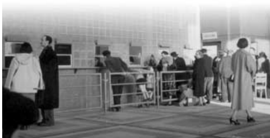
Passagers devant le bloc contrôle de la salle d'attente des 1 res classes.