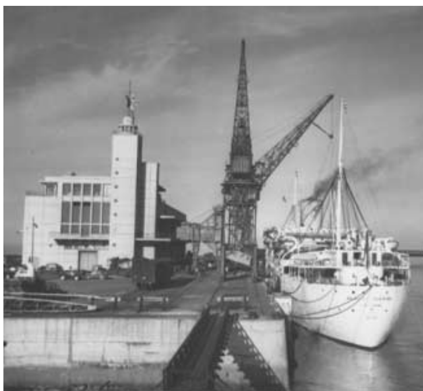
Escale du Reina del Pacifico avec la passerelle qui reliait directement le paquebot au premier étage de la gare maritime.